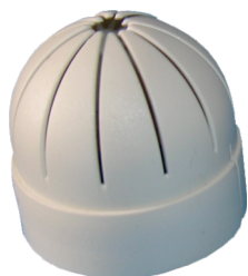
Retenedor de amostras (Core Catcher)